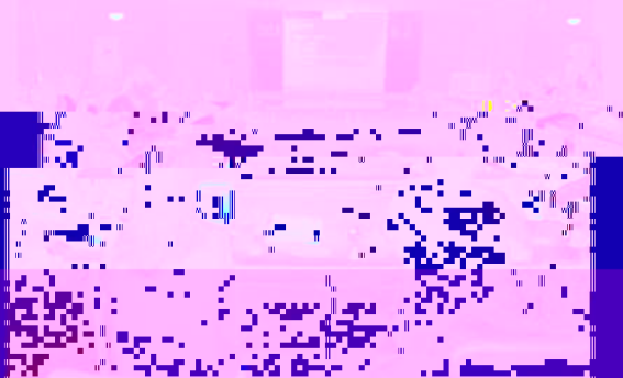
教育学院研究生汇报交流会现场

近日为止,教育学院举办了第五届研究生汇报交流会暨研究生论坛,邀请了心理学、教育心理学、教育学、教育技术学、教育心理学等专业的研究生汇报和交流了他们在学术、科研、社会实践、就业等方面取得的成绩和心得体会。会上,各位研究生就自己的研究成果进行了精彩的展示。此次交流会不仅为研究生提供了一个展示自己研究成果的平台,也为广大研究生提供了一个互相学习和交流的机会。