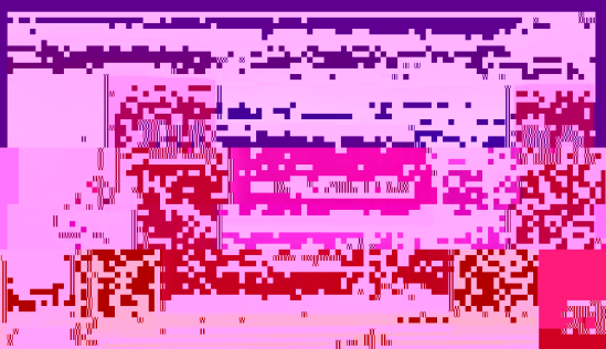
教育学院研究生汇报交流会现场

此次交流会分为学术汇报和学术论坛两部分,首先由各系研究生进行学术汇报,随后进行了学术论坛。学术汇报环节,各系研究生就自己的研究成果进行了精彩的展示。学术论坛环节,邀请了各位研究生就自己的研究成果进行了精彩的发言。